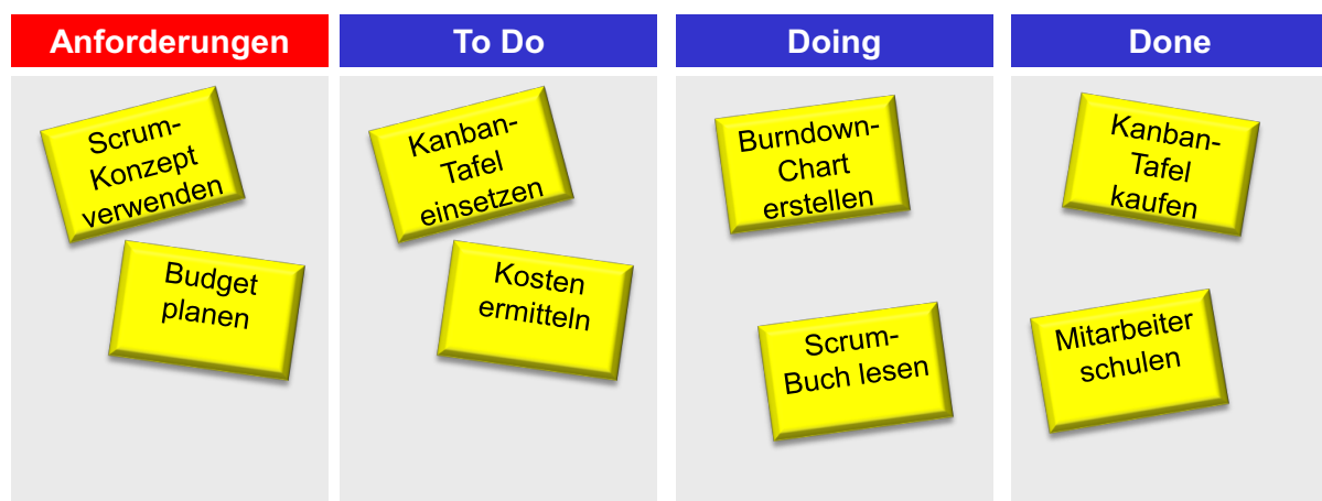
Abb. 5 Scrum – Kanban-Tafel

Häufig besteht das Taskboard aus den in Abb. 5 zu sehenden vier Spalten. In der ersten Spalte werden die Anforderungen aus dem Product-Backlog definiert, die das Entwicklungsteam für den jeweiligen Sprint ausgewählt hat. Die weiteren Spalten enthalten – wie in Abb. 5 zu sehen – die zur Umsetzung erforderlichen Tasks in ihrem jeweiligen Bearbeitungsstand.